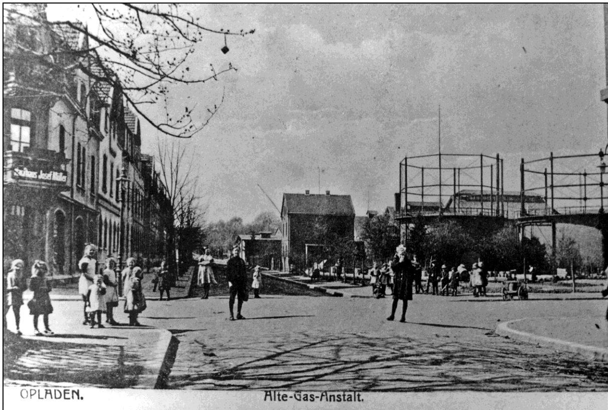
(2) Ansichtskarte vom alten Gaswerk aus dem Jahr 1914

gierte man „im vaterländischen Interesse“ 3 : Am 4. März 1916 wurde die Gaserzeugung in Opladen eingestellt und die Stadt an das Ferngasnetz der Ruhrgas AG in Essen angeschlossen.