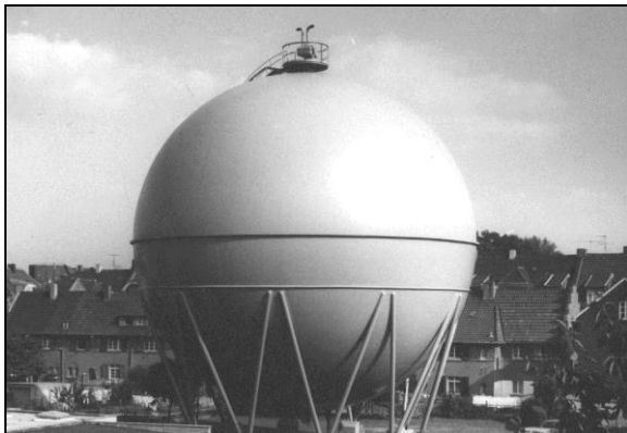
(3) Die Gaskugel 1969

Im Jahre 1958 wurden die beiden aus den Jahren 1895 und 1910 stammenden Gaskessel demontiert und 1959 durch die große Gaskugel ersetzt, die „viele Jahrzehnte ein Wahrzeichen von Opladen“ 4 war. Sie hatte bei einem Durchmesser von 19,72 m eine Höhe von 23 m, ein Fassungsvermögen von 20.000 cbm Gas und ein Gewicht von 180 t. Der Behälter diente dem Ausgleich der unterschiedlichen Verbrauchsanforderungen und der Sicherheit der Versorgung. Im November 1969 erfolgte die Umstellung von Kokereigas auf Erdgas.