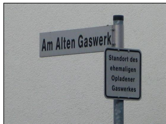
(4) Straßenschild an der Ecke Birkenbergstraße 2011