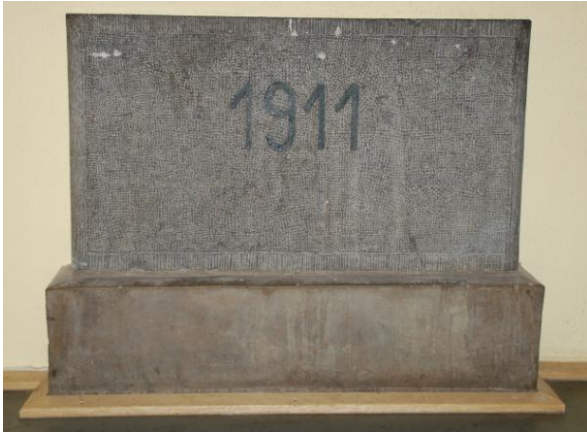
(2) Der Grundstein im Schulgebäude „Im Hederichsfeld“

Im Oktober 1906 wurde die Schule gegründet. Bevor sie 1913 das Gebäude Im Hederichsfeld beziehen konnte, wurden die Schüler provisorisch in privaten Räumen an der Düsseldorfer Straße 89, in Räumen der katholischen Volksschule, in einer zweiklassigen Schulbaracke und im kleinen Saal des Hotel Hohns unterrichtet.