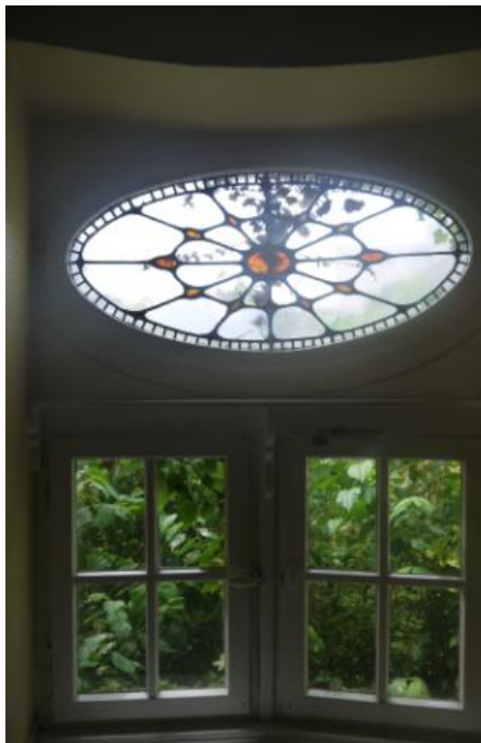
(7) Glasornament im Nebentreppenhaus