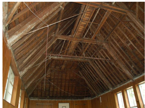
(6) Dachstuhl der Turnhalle