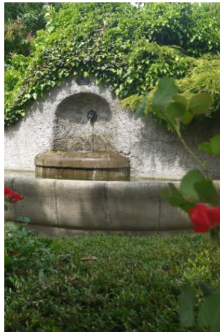
(8) Brunnen im Außenbereich