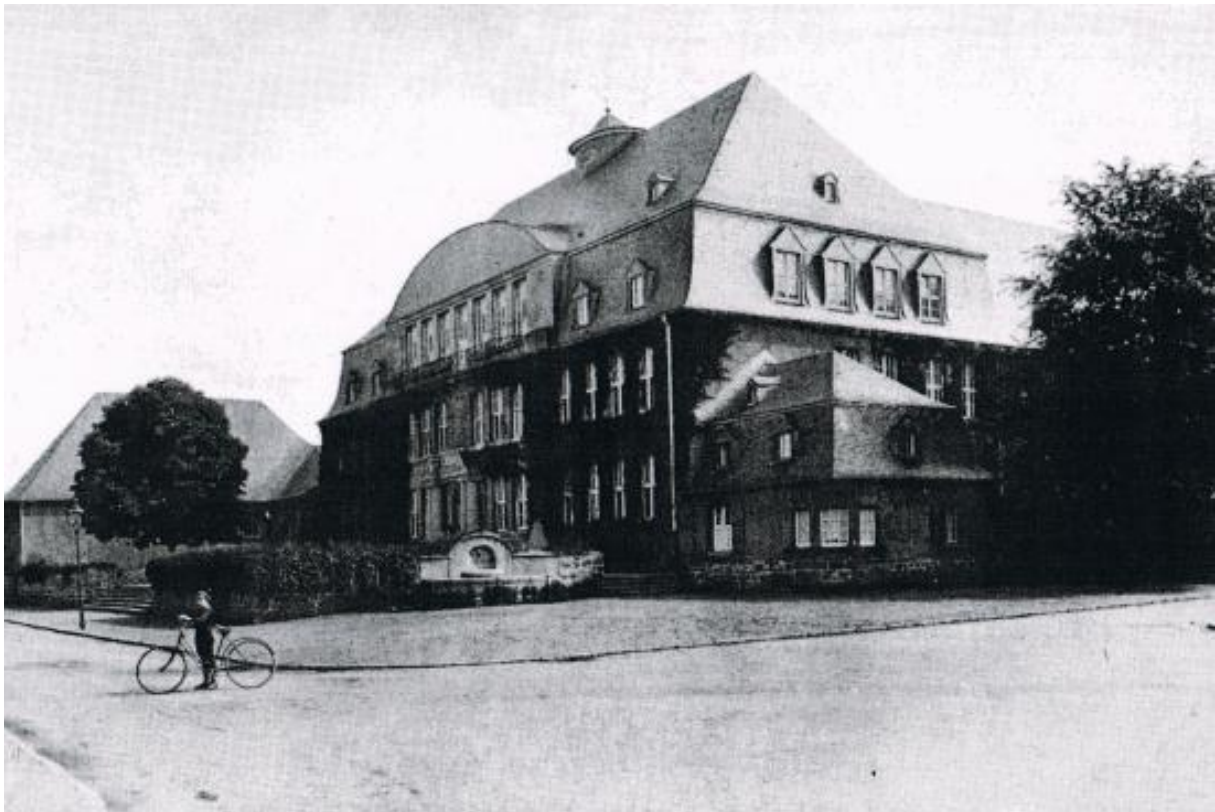
(1) Blick auf das Schulgebäude von Südwesten - Ecke Schillerstraße (vor 1924)