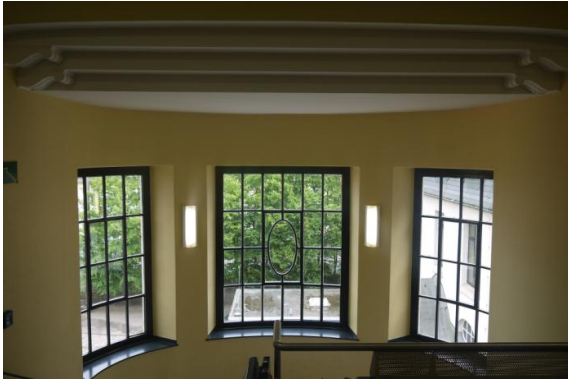
(3) Im Haupttreppenhaus (Blick in Richtung Humboldtstraße)