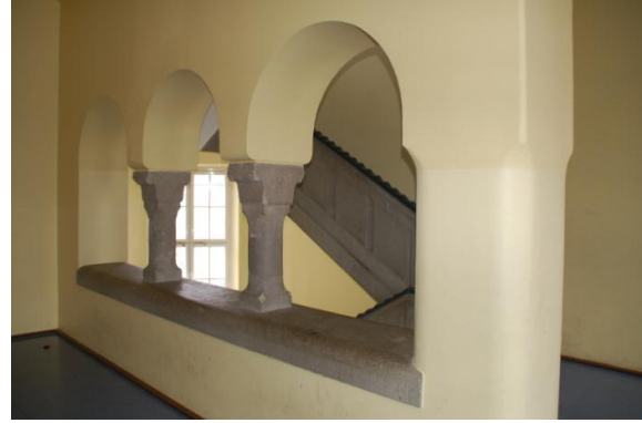
(4) Im Nebentreppenhaus (Blick in Richtung Schillerstraße)